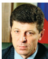
Д.Н.Козак, заместитель председателя Правительства Российской Федерации