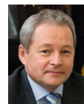
В.Ф.Басаргин, Министр регионального развития РФ