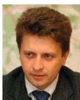
М.Ю.Соколов, Директор департамента промышленности и инфраструктуры Правительства Российской Федерации