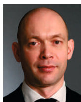
В.В.Семенов, Президент ГУД, Председатель комитета по строительству Администрации Санкт-Петербурга