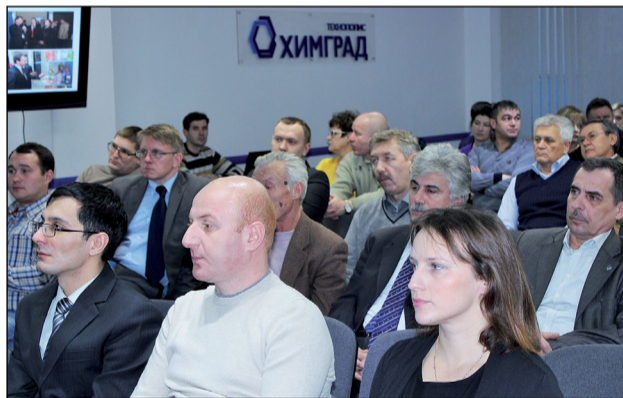
Резиденты Технополиса «Химград»

В завершение итоговой Ежеквартальной встречи для резидентов и партнеров «Химграда» состоялся праздничный новогодний фуршет.