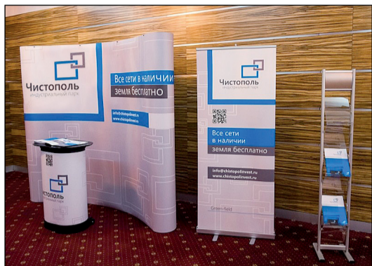
Презентация Индустриального парка «Чистополь» на Саммите

Анализ рынка индустриальной и складской недвижимости привел